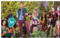
Отряд рицари 10 серии, 1 сезон