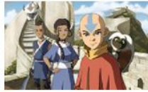
Аватар: Последният повелител на въздуха 20 серии, 1 сезон