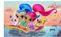
Искрица и Сияйница 20 серии, 1 сезон