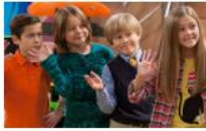
Ники, Рики, Дики и Дона сезон 1, 20 епизода