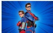
Опасният Хенри сезон 5, 10 епизод