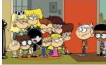
Къщата на Шумникови 20 серии, 1 сезон