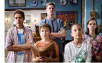
Мистериите на Хънтър Стрийт 10 серии, 1 сезон