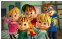
Алвин и катеричоците 1 сезон, 25 епизода