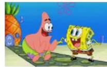
Спондж Боб Квадратни гащи 10 серии, 1 сезон