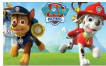
Пес Патрул по 20 серии от 1, 2 и 3 сезон