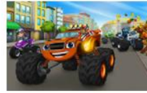
Пламъчко и машините 20 серии, 1 сезон