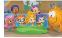
Рибки балони 20 серии, 1 сезон